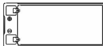
F2 (FASTON TAB 250)